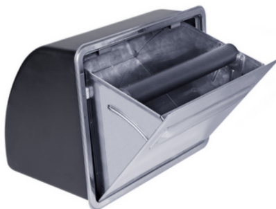
Dampkap Protective dampcover