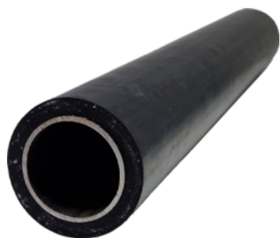
Uitklopstang Filter rammer rod